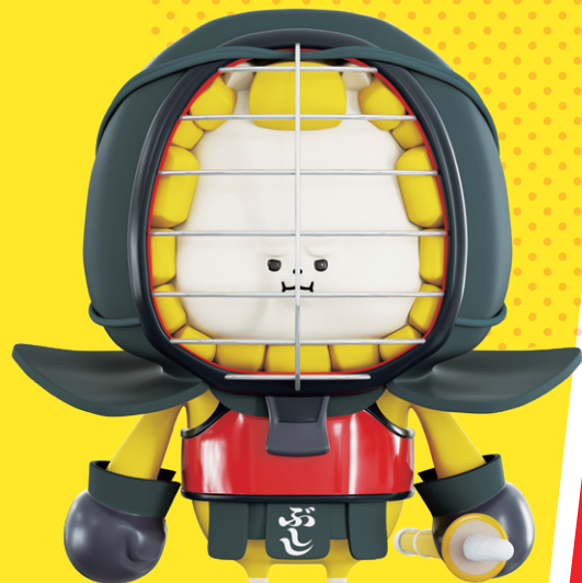
剣道普及キャラクター 「ぶしし」

剣道界最大のイベントである国際剣道連盟主催の「世界剣道選手権大会 (WKC)」。令和 9 年 (2027) に日本で開催される「第 20 回世界剣道選手権大会 (20WKC)」を契機に、全日本剣道連盟 (全剣連) の WKC に関する活動を支援し、国内外への剣道振興に繋げる「剣道世界大会応援クラブ」を創設します。剣道愛好者のみなさまから賜りましたご支援を原資として、 全剣連の WKC 活動及び積極的な国内外での普及活動に活用させていただく制度です。 みなさまのご賛同よろしくお願いいたします。